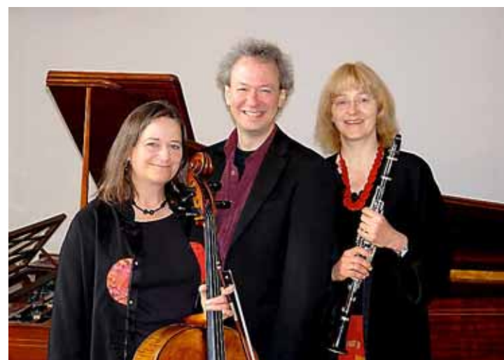
Het Frühling Trio.

Concert: Frühling Trio (klarinet, cello en piano) op vrijdag 9 november, aanvang 20.15 uur, Stadhuis Weesp, Nieuwstraat 41, Weesp. Toegang 12 euro (tot 16 jaar gratis; www.stad-huisconcerten.nl).