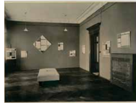
Zaaloverzicht van de tentoonstelling 'Mondrian – Man Ray' bij galerie Kunstausstellung Kühl & Kühn te Dresden. Het betreffende werk hangt links van de deuropening.

De Antwerpse modeontwerper, gefascineerd en geïnspireerd door het fenomeen masker, geeft er zijn eigenzinnige kijk op het masker in de mode en de kunst, maar ook als fetisj en ritueel object (01-09 t/m 07-01) +++ De eerstkomende veiling van Notarishuis Arnhem zal plaatsvinden op hun gloednieuwe locatie op het adres De Toekomst 4. Dit bevindt zich op het bedrijventerrein de Seingraaf te Duiven. De ruimte – die twee maal zo groot is als de oude – kan reeds bewonderd worden tijdens de kijkdagen op 2 en 3 september, gevolgd door de veiling op 4 september +++ Vijf conservatoren van het Keramiekmuseum Princessehof en het Fries Museum zullen op woensdag 6 september klaar zitten om uw vragen te beantwoorden tijdens het antiëkspreekuur. U mag tot drie stukken Europese of Aziatische keramiek, schilderijen en prenten, zilver en historisch textiel meebrengen +++ Eveneens op 6 september gaat het nieuwe theater en de nieuwe centrale hal van Singer Laren officieel open. Maar bewoners van Laren wachten misschien het best tot 10