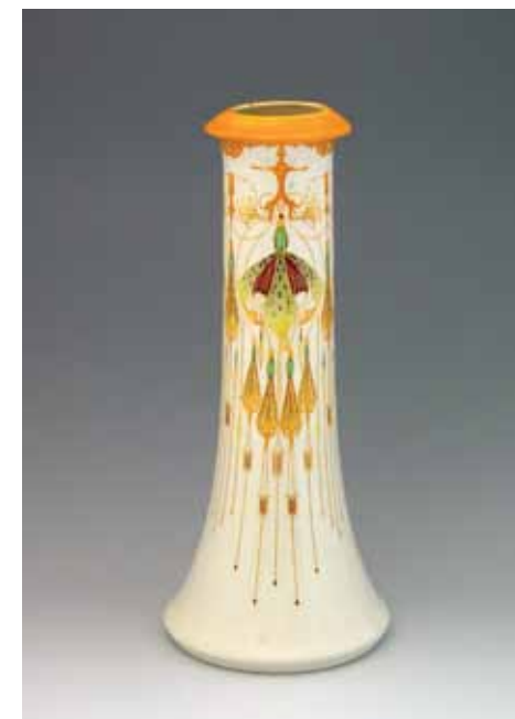
NV Haga, model 3004, vaas met tijgerlelies. Herkomst: collectie Meentwijk. Collectie Purmerends Museum.