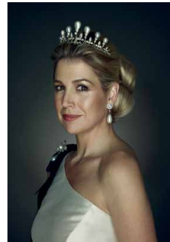
Erwin Olaf, 'Her Royal Highness Princess Máxima of the Netherlands', 2011. Te zien op 'Vrouwen van Oranje' in Museum Jan Cunen.

het Universiteitsmuseum. Extra leuk zijn de performances, muzikale omlijsting, workshops en ontmoetingen met kunstenaars en ontwerpers. www.groningermuseumnacht.nl +++ Emeritus hoogleraar en kunstenaar Carel Blotkamp heeft de vaste collectie van Museum Boijmans Van Beuningen volledig anders opgesteld, met de bedoeling de bezoekers te verleiden om langer naar de stukken te kijken. Op 10, 17 en 24 september geeft hij uitleg bij deze presentatie 'De collectie als tijdmachine' in een serie korte colleges +++ In juni werd het elfde en laatste deel van de reeks 'Kunstkritiek in Nederland 1885-2015' gepubliceerd. Als finale afronding komen de auteurs op 15 september samen in het Auditorium van het Rijksmuseum voor een symposium over de betekenis van de kunstkritiek in de huidige kunstwereld +++ Een dag later, op 16 september, wordt u in Gorsel verwacht, waar het Venduehuis Den Haag een taxatiedag in Museum MORE houdt +++ In de nieuwe tentoonstellingen 'The Making of Modern Art' en 'The Way Beyond Art' onderzoekt het Van Abbe-museum hoe de veranderende wereld de moderne kunst mee heeft gecreëerd, maar ook hoe onze visie op onze omgeving verandert dankzij kunst. Deze kaderen in een