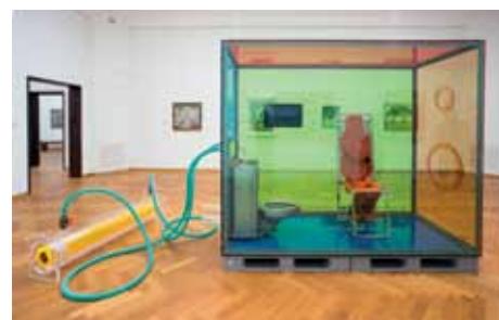
Folkert de Jong, 'Doctrine of Salvation', 2015. Collectie Gemeentemuseum Den Haag.

de zestig stukken art-nouveau-aardewerk staan die onlangs verworven werden uit de Collectie Meentwijk van verzamelaar Dirk Nienhuis +++ Waldemar Grzimek (1918-1984) is een van de bekendste beeldhouwers van het naoorlogse Duitsland. Zijn dochter schonk zijn nalatenschap aan een aantal Duitse musea, maar ook aan één Nederlands museum: Museum Beelden aan Zee kreeg in totaal 20 sculpturen en 200 tekeningen +++ Typerend voor het bevreedende oeuvre van Folkert de Jong is diens installatie 'Doctrine of Salvation', dat voortaan deel uitmaakt van de vaste collectie van het Gemeentemuseum Den Haag . Het werk ziet er uit als een soort glazen cel, waarop een mysterieuze koker is aangesloten +++ En tot slot is het Westfries Museum plotsklaps € 1,7 miljoen