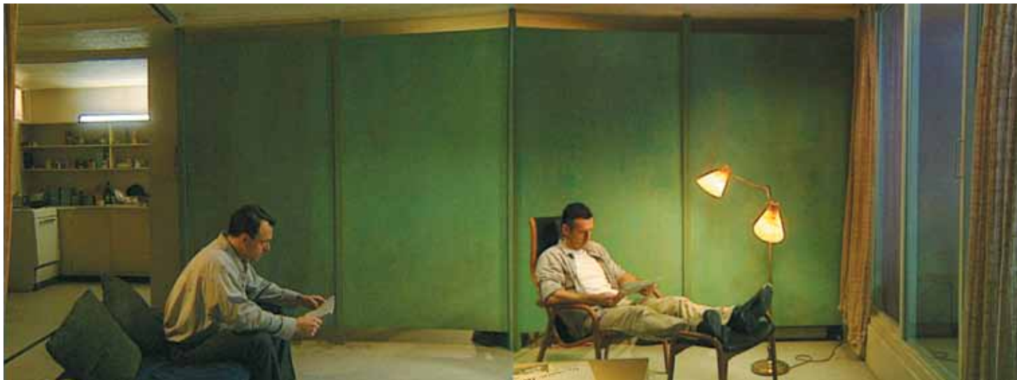
Stan Douglas, 'Win, Place or Show', 1998. Collectie De Pont Museum, Tilburg.

september. Want dan zijn zij allen te gast op het feest, dat opgeluisterd wordt door optredens van Edsilia Rombley en de bigband van het Conservatorium Amsterdam +++ Haast u naar de site van de Groninger Museumnacht , want daar kunt u voor € 5 een passe-partout kopen die u op 9 september tot na middernacht toegang geeft tot het GRID Grafisch Museum, het Groninger Museum, het Nederlands Stripmuseum, het Noordelijk Scheepvaartmuseum én