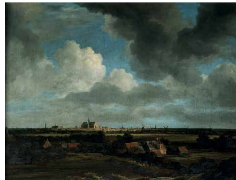
Jacob van Ruisdael, 'Gezicht op Haarlem', ca.1660