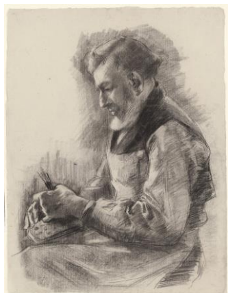
Fig. III. Blinde borstelmaker. Zwart krijt, 620 x 475 mm. Amsterdam, Rijksmuseum, inv.nr. RP-T-1911-23. Legaat L.W.R. Wenckebach