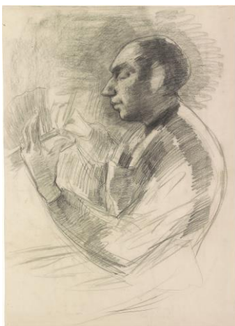
Fig. I. Blinde borstelmaker. Zwart krijt, 755 x 548 mm. Amsterdam, Rijksmuseum, inv.nr. RP-T-1911-26. Legaat L.W.R. Wenckebach.

Als voetnoot bij de 'Blinde borstelmakers' valt nog te melden dat er drie jaar na Van Rappards overlijden een commissie voor onderzoek en rapport werd ingesteld betreffende een klacht van een lokale borstelfabrikant, die meende dat de Utrechtse blindeninrichting zich schuldig maakte aan oneigenlijke concurrentie en marktbederf door haar borstels tegen te lage prijzen op de markt te brengen.