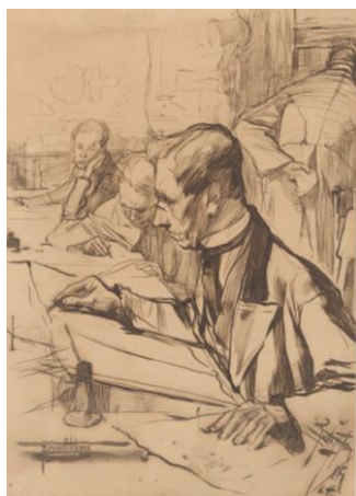
Fig. IV. Pieter Josselin de Jong, 'Pennelikkers', 1885. Pen in bruine inkt, gekrabd. Met title l.o., gesigneerd, gedateerd en gelocaliseerd 'Den Haag' r.o. 426 x 308 mm. Amsterdam, Rijksmuseum, inv.nr. RP-T-1978-22. Legaat mevrouw A.E. Reich-Hohwü